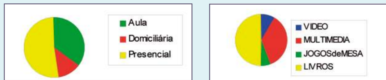
UTILIZAÇÃO DA BIBLIOTECA

O grosso da utilização continua sendo presencial. Embora a utilização domiciliária continue sensivelmente sem alteração, a utilização dos documentos em aula aumentou consideravelmente.