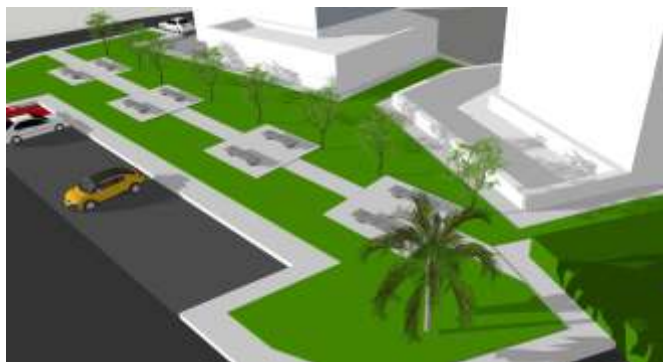
Exemplo de proposta a executar