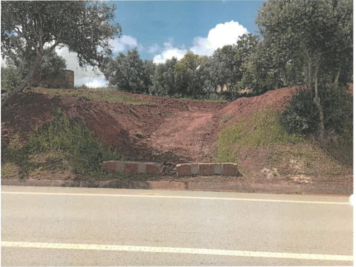
Legenda: Vista geral da movimentação de terras.