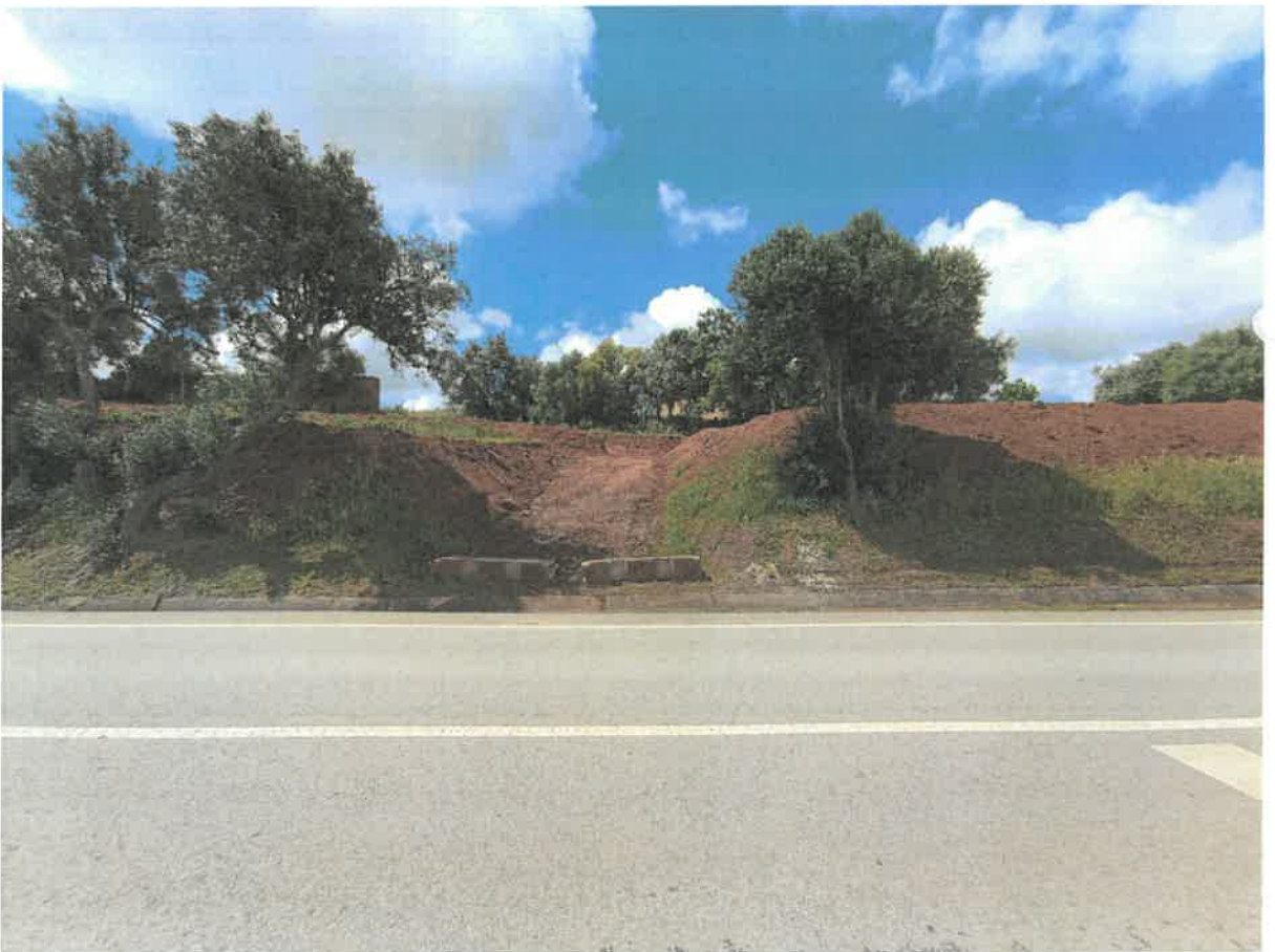
Legenda: Vista geral da movimentação de terras.