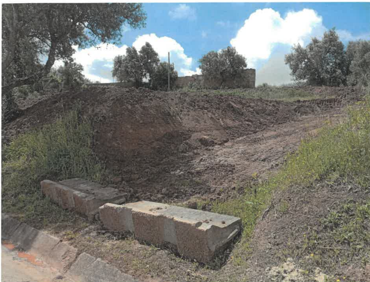
Legenda: Vista geral da movimentação de terras.