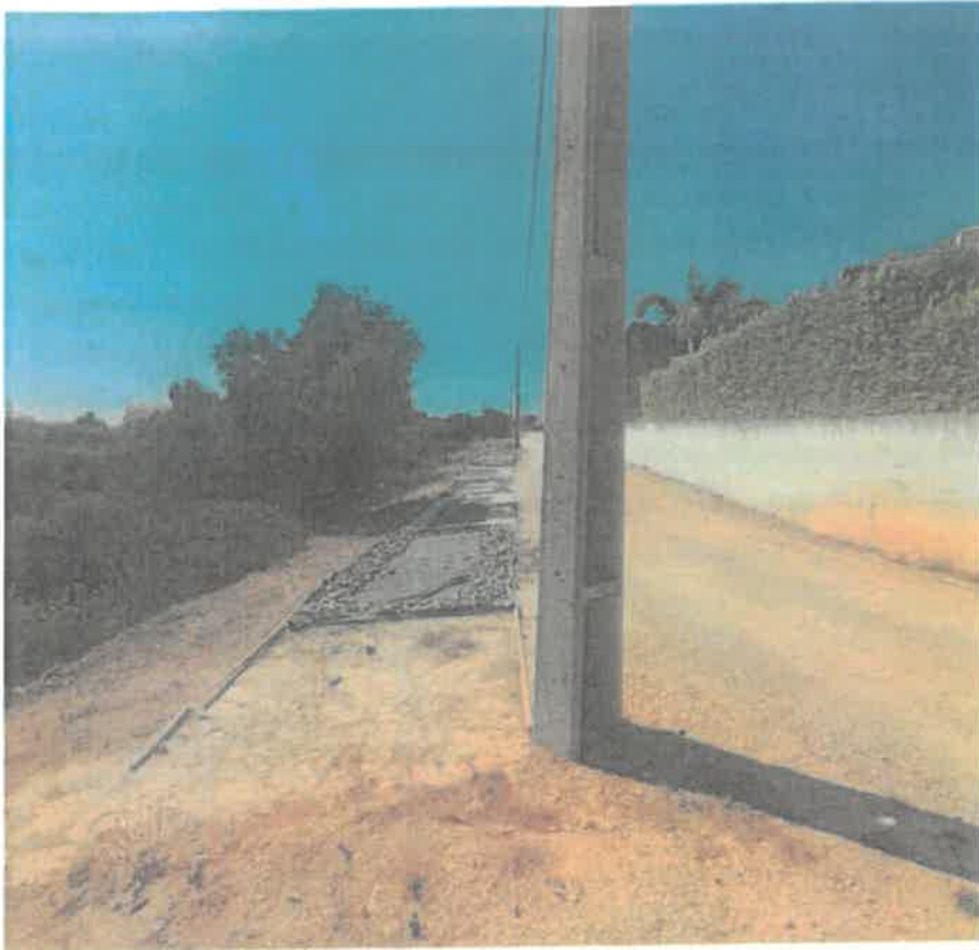
Legenda: Arranjos exteriores em execução a noroeste do prédio da requerente, com as mesmas características dos arranjos exteriores em execução a sul do prédio da requerente