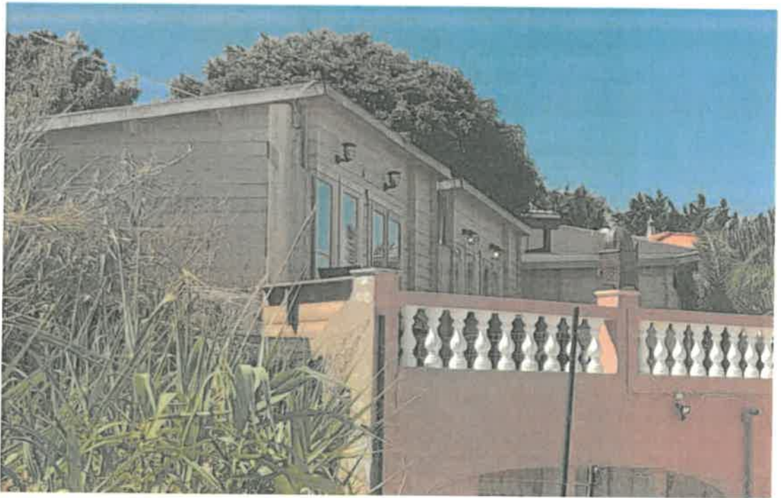
Legenda: Bungalows ilegais com ocupação/utilização humana