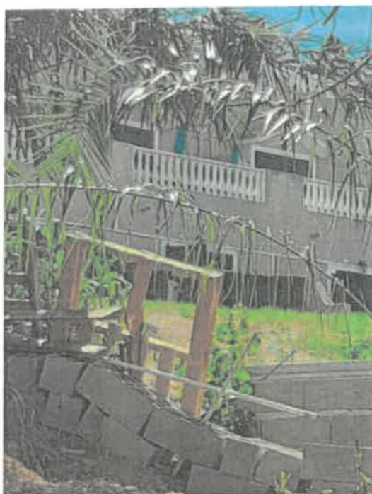
Legenda: Fossa ilegal em execução