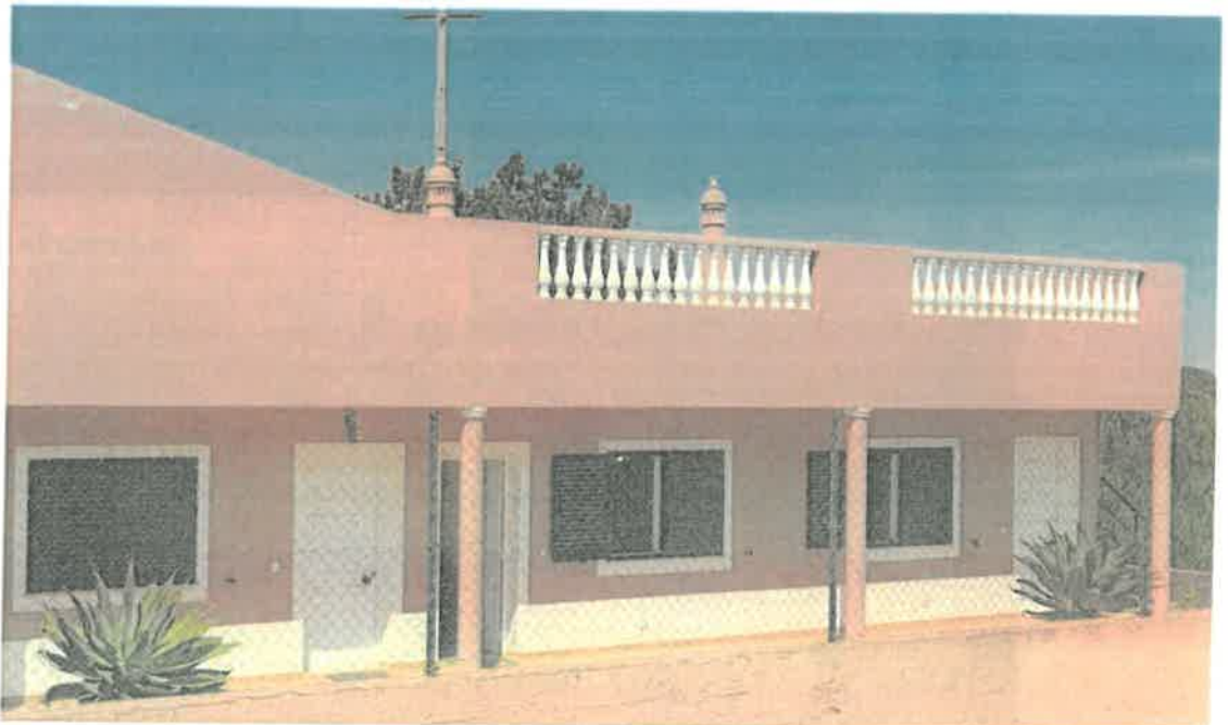
Legenda: Blocos de apartamentos com utilização com ocupação/utilização humana