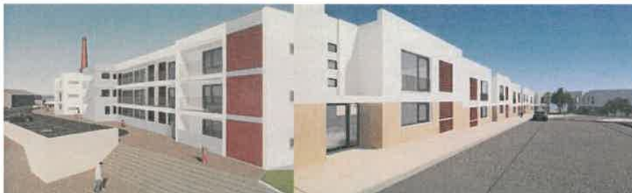
51 Fogos em Santo Amaro.

71 fogos em concurso de conceção/construção 51 em Lagos - Santo Amaro e 20 em Bensafrim (concurso para atribuição de fogos a abrir brevemente);