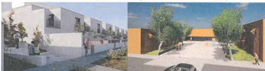
24 Fogos no Chinicato.

- 38 Fogos com empreitada de conceção e construção adjudicada, 24 no Chinicato e 14 em Bensafrim, com concurso para atribuição a abrir brevemente;