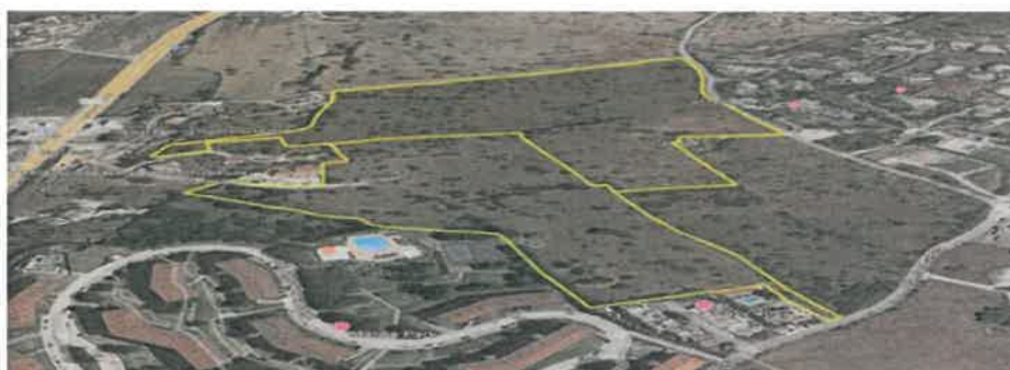
imagem com delimitação do perímetro da área onde serão edificados os 500 fogos.

- Processo para construção de 500 fogos (1.ª fase) para venda a custos controlados (Marina Park II – Caliças - Lagos).