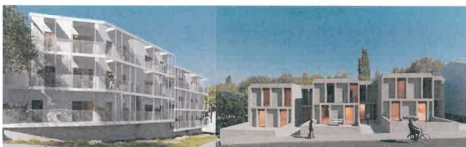
12 Fogos na Cerca do Cemitério – Lagos.

- A construção de 18 fogos, 12 em Lagos, na Cerca do Cemitério, e 6 em Barão de São João (fogos já atribuídos por concurso);