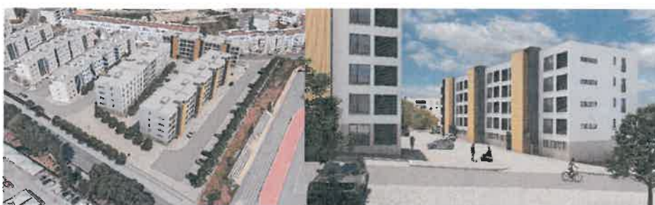
104 Fogos + cohousing na Chesgal – Lagos.

- 104 + cohousing em Lagos – Chesgal (empreitada adjudicada, com concurso para atribuição de fogos a abrir brevemente);