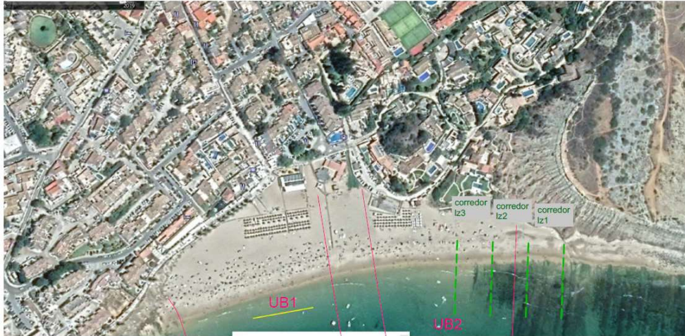
Corredores de surf - PRAIA DA LUZ - época de novembro a maio