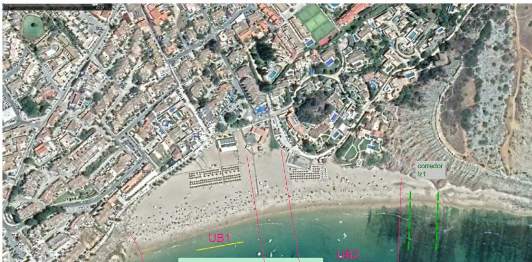
Corredores de surf - PRAIA DA LUZ - época de junho a outubro